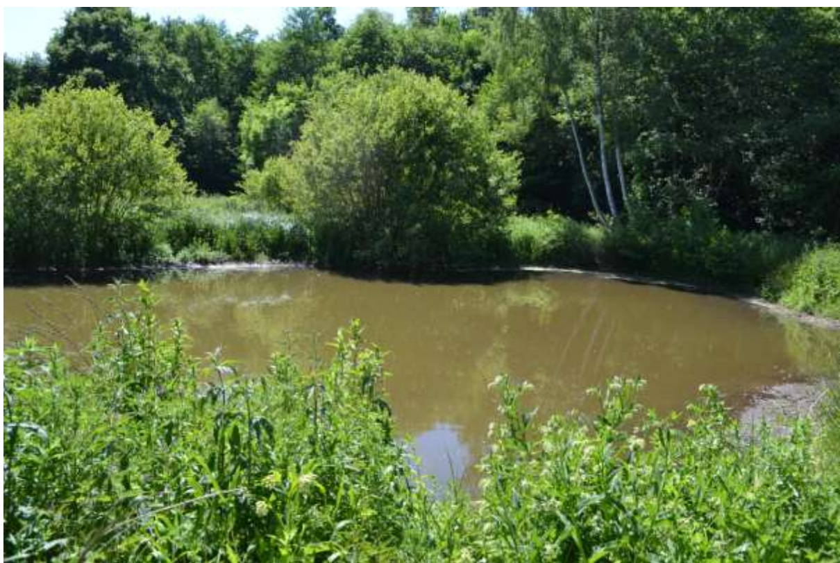
Mare n° 2