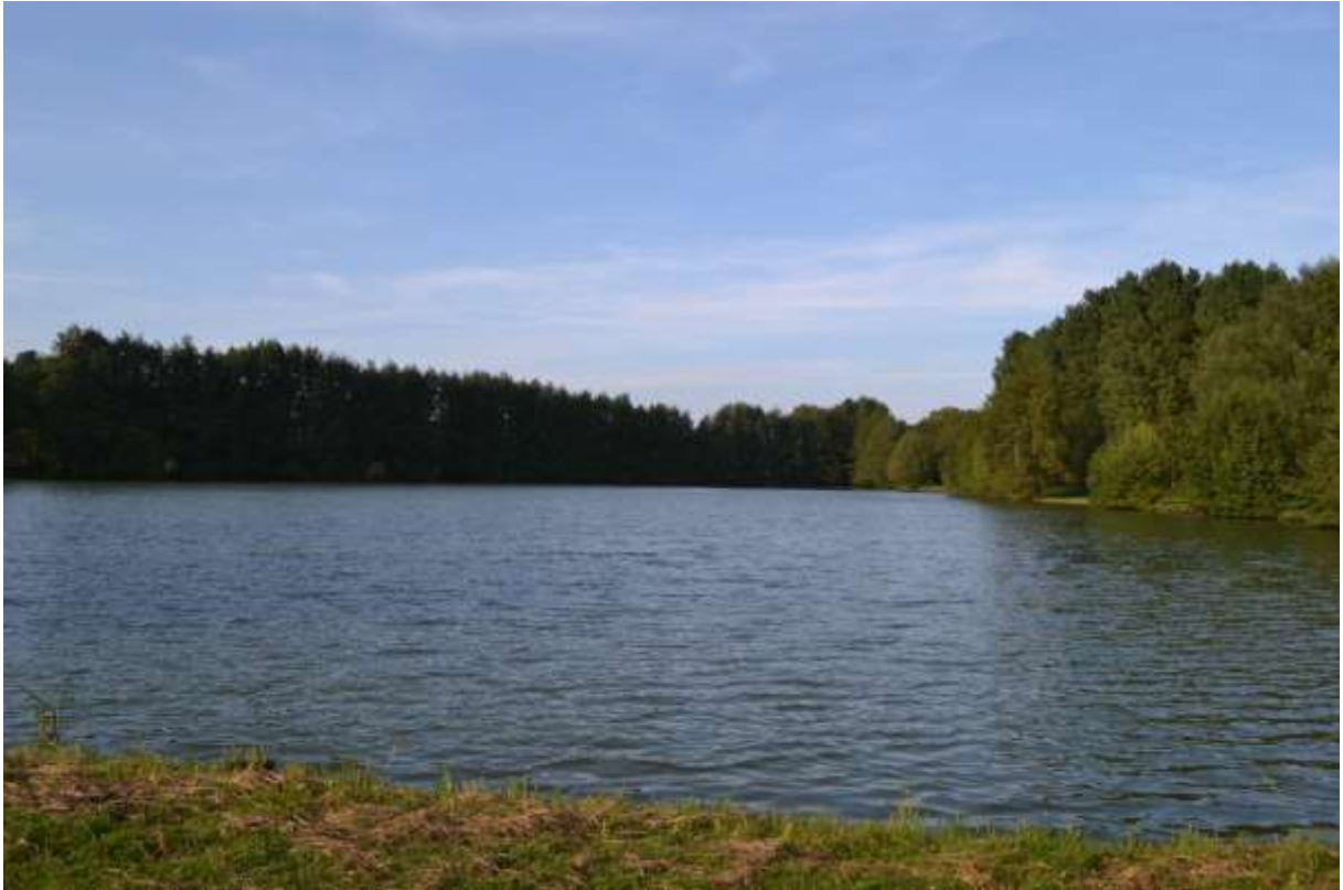
Etang communal de Bérrou-la-Mulotière