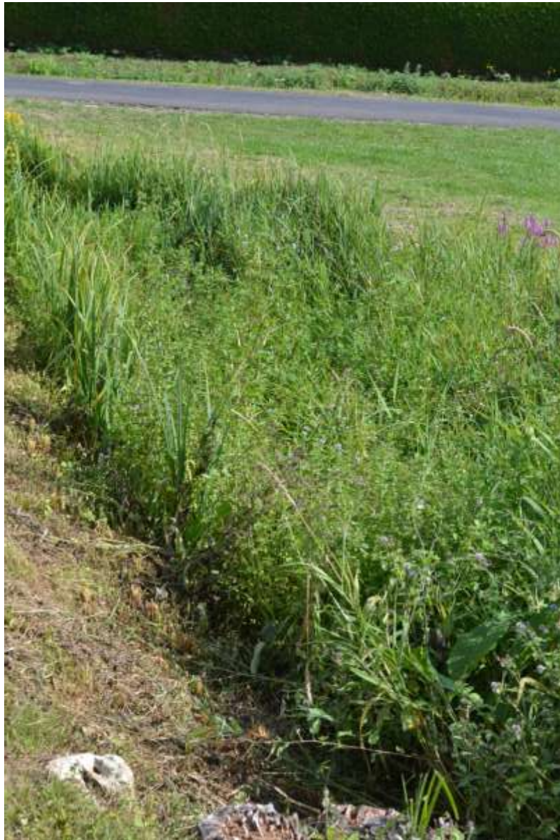
Bras mort de l'étang communal