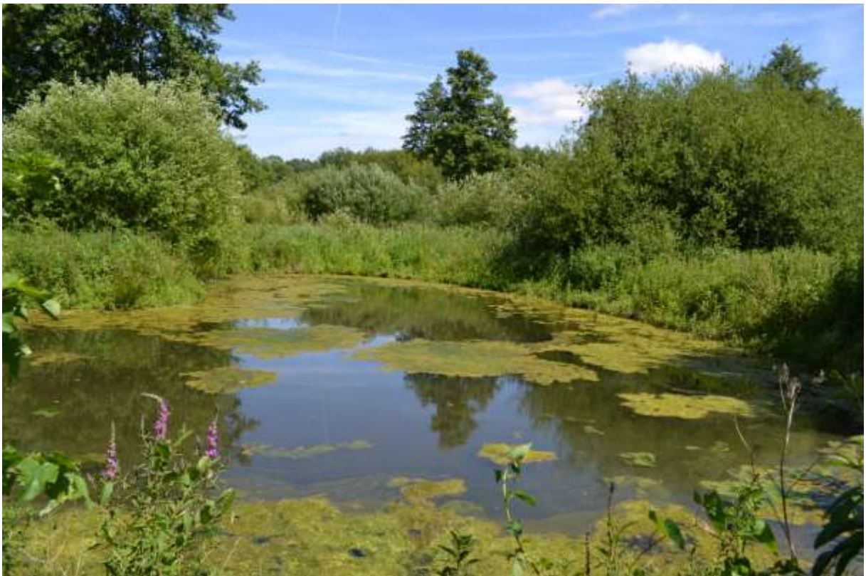
Mare n° 1